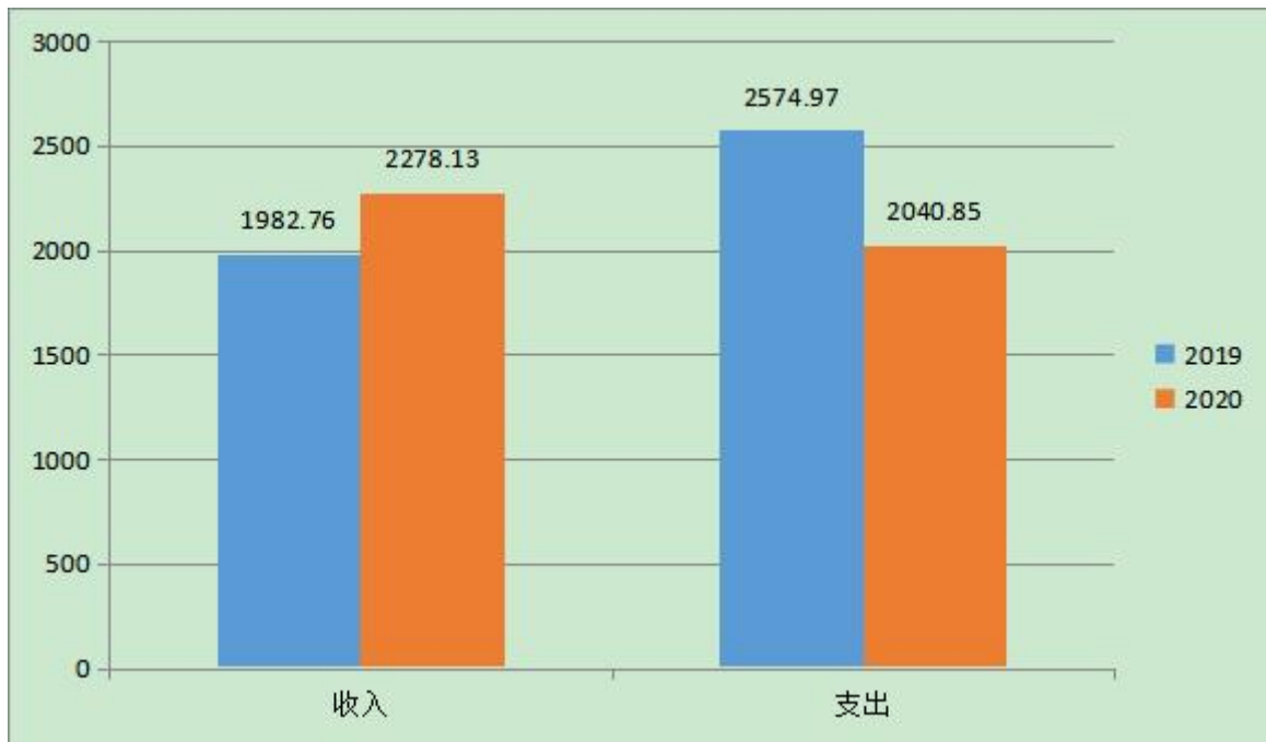
2019 年与 2020 年财政拨款收支对比（图 4）