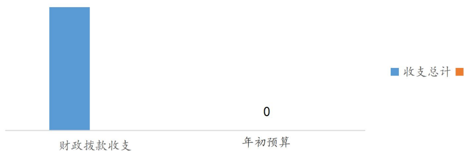
财政拨款收入支出与年初预算对比情况 (图3)

本单位 2020 年度一般公共预算财政拨款收入 26.26 万元，完成年初预算的 100%，比年初预算增加 26.26 万元，主要是职工取暖补贴；本年支出 26.26 万元，完成年初预算的 100%，比年初预算增加 26.26 万元，主要是职工取暖补贴，原因是本单位不向财政局报送人员经费预算。