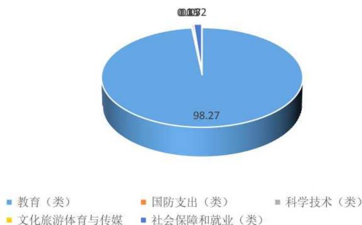
财政拨款支出决算结构（按功能分类）

2020 年度财政拨款支出 25045.52 万元，主要用于以下方面：教育（类）支出 24612.59 万元，占 98.27%；国防支出（类）支出 0.03 万元，占 0.03%；科学技术（类）支出 78 万元，占 0.31%；文化旅游体育与传媒支出 17 万元，占 0.07%；社会保障和就业（类）支出 330.93 万元，占 1.32%。