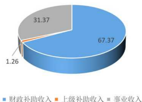
2020年度收入决算构成图

本单位 2020 年度收入合计 37951.40 万元，其中：财政拨款收入 25568.85 万元，占 67.37%；上级补助收入 476.72 万元，占 1.26%；事业收入 11905.83 万元，占 31.37%。